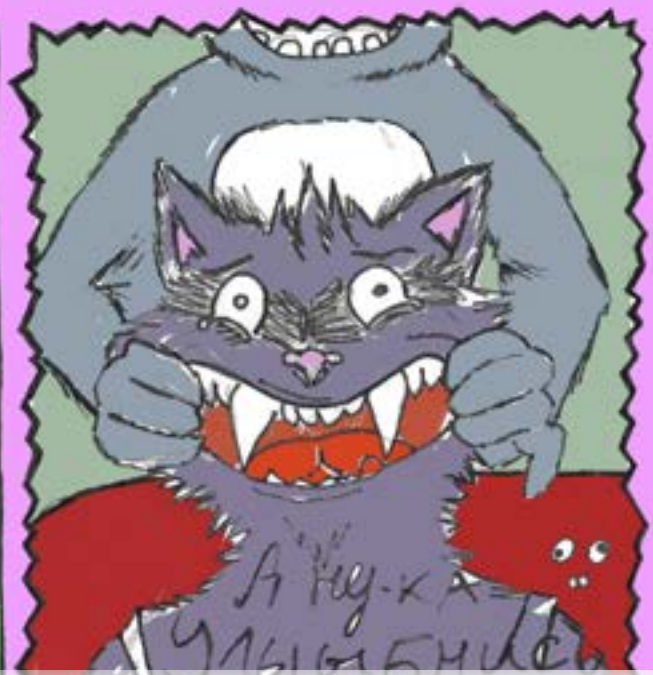
автор комикса про енота: Линда Рябина